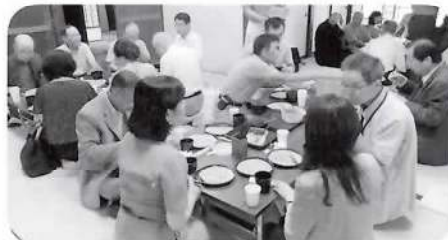
交流会は手打ちそばに舌鼓