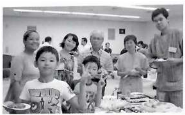
↑ホストファミリー交流会

このような掛川の文化を知ってもらう一方、富士登山や子ども国際交流パーティでは、市民の皆さまとの交流を深めてもらいました。