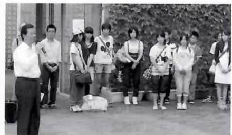
出発の朝は、早くから松井市長がお見送りに。