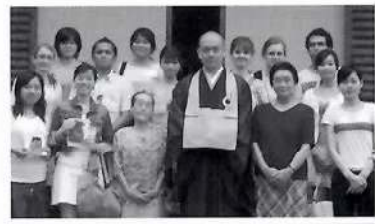
先代から続く貞永寺での坐禅&お茶会