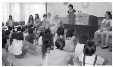
留学生と子ども達の交流会も夏休み恒例