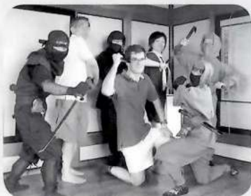
ホストファミリーと掛川城にて

素晴らしい10日間に感謝。この思い出を大切に、掛川市のことを友だちや日本に興味のある人達に伝えたいと思います。