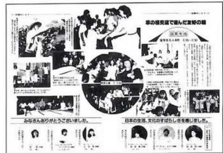
広報だいたうに掲載された「第1回」

当時、留学生は国内に約1万2千人（現在は約14万人）、そして、この留学生ホームステイプログラムは、北海道に次いで、全国で2番目に企画されたものでした。この30年間でホームステイした留学生は350人以上、国は約40ヶ国に及びます。