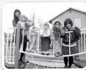
公園での楽しいひととき