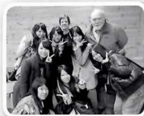
ユージンの姉妹都市委員と