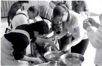
食品サンプル作り体験

第2期日本語教室は9月29日(日曜日)から始まります。今年度も日本語教室の活動を支えてくださるサポーターさんを募集中です!!