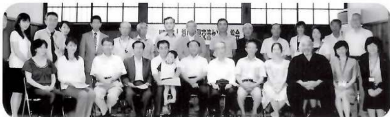
無事に議事も終了して全員でパチリ！

総会終了後は、会員ボランティア交流会として「掛川蕎麦研究会」の皆様の手打ちそばの振る舞いをさせていただきました。美味しい蕎麦をいただきながら、和やかに親交を深めることができました。