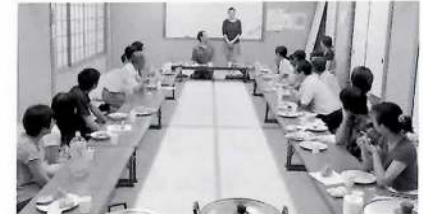
カレーパーティー（歓迎会）