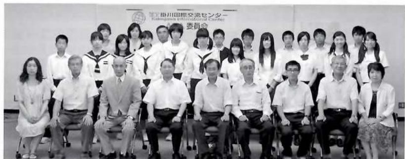
掛川市の代表として任命され 気持ちのひきしめる結団式