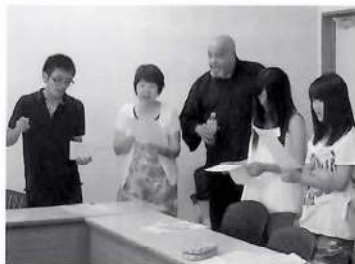
勉強会を通してひとつのチームとしての意識が高まります。