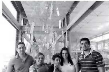
家族の健康や幸せを願った七夕飾り