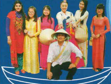
※写真は昨年の様子