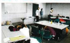
地震の際の行動について