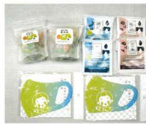
掛川からのプレゼント

今年度は新型コロナウイルス感染症拡大のため、米国姉妹都市のユージン市やコーニング市との訪問団の派遣と受入れが中止になりました。そこで、それぞれの姉妹都市委員会に、茶のみやきんじろうマスクと掛川深蒸し茶等の詰め合わせを贈り交流活動の一環としました。「楽しくシェアしました」と、アメリカの皆さんからお礼のメッセージが届きました。