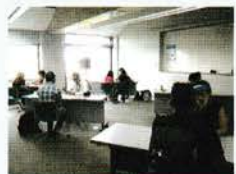
感染症防止対策をしています

「こんにちは」から始まるコミュニケーション。日本語で話せば、職場や地域の人たちとの距離がずっと近くなります。先生から日本語を、日本語教室サポーターから文字を学びます。