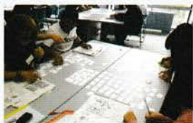
文字クラスの様子

掛川市日本語教室では、日本での暮らしに必要な知識も学びます。今年度は、いざという時の知識を学びました。