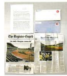
マーガレットさんからの お礼の手紙